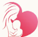
Atención por maternidad